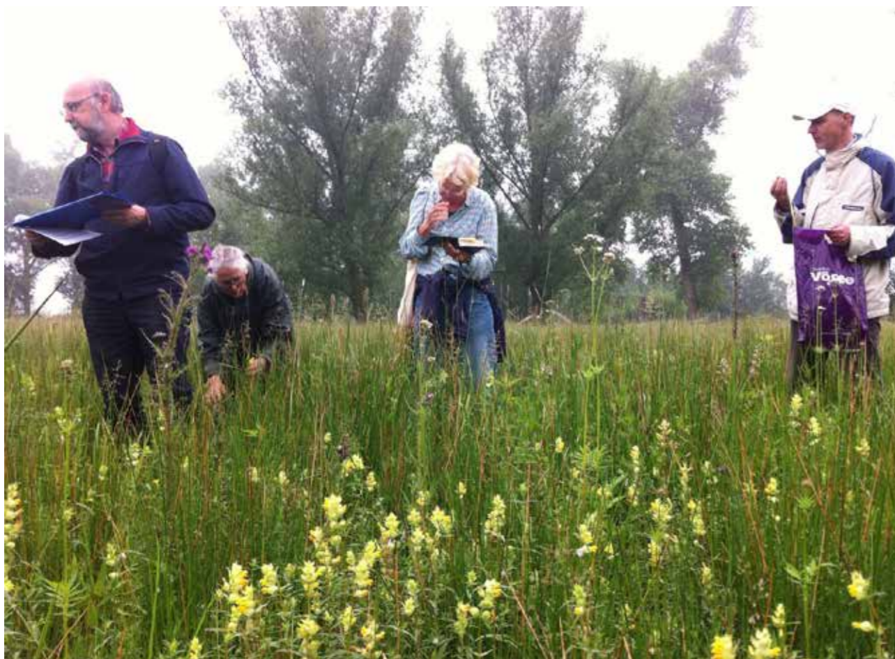
De plantenwerkgroep ontdekte de Grote Ratelaar als nieuwe soort.

In juli hebben we het eerste perceel van de hooilanden opnieuw laten maaien, deze keer met een tweewielige trekker met vingerbalkmaaier. Door twee keer per jaar te maaien worden er nog meer voedingsstoffen afgevoerd en verschaalt het gebied sneller. Volgend jaar zullen we zien of het twee keer maaien inderdaad effect heeft op de ontwikkeling van de vegetatie.