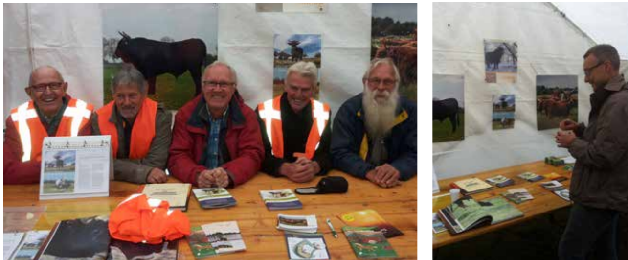
Op de foto's vijf van de zeven leden van de werkgroep en één van de spaarzame belangstellenden in onze stand.

Onze bijdrage bestond uit het inrichten van een informatiestand over onze activiteiten en over de stichting Taurus, de eigenaar van onze Hooglanders en medeontwikkelaar van het oerrund, de Tauros.