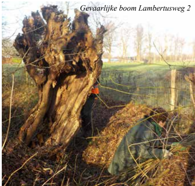
Gevaarlijke boom Lambertusweg 2

Op diverse foto's krijgt u een beeld van het werken bij de grote diversiteit aan adressen: langs de openbare weg met verkeersregelarij, bij sloten, dikke bomen, dunne bomen, gevaarlijke stammen, (stroom)draad, bramenstruwelen die eerst geschoond moeten worden, en het maken van takkenwallen, pyramidale